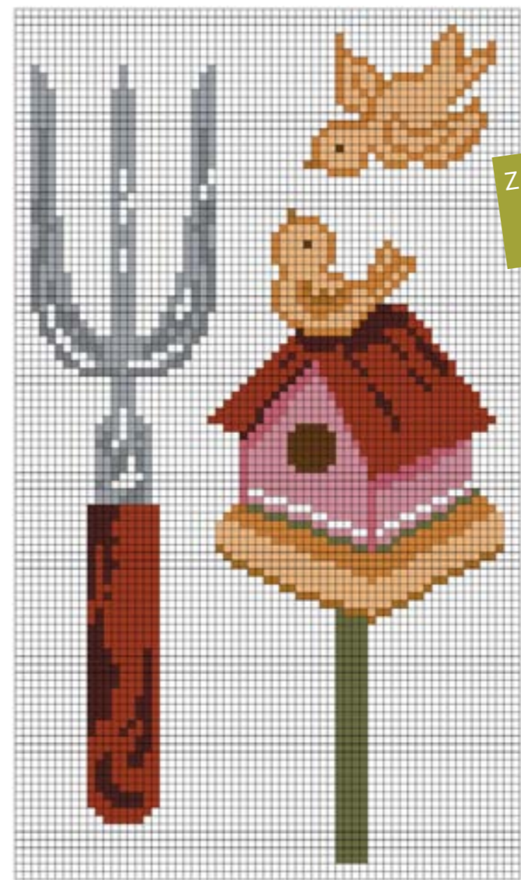
ZAHRADNÍ KAPSÁŘ vyšívání strana 54-55